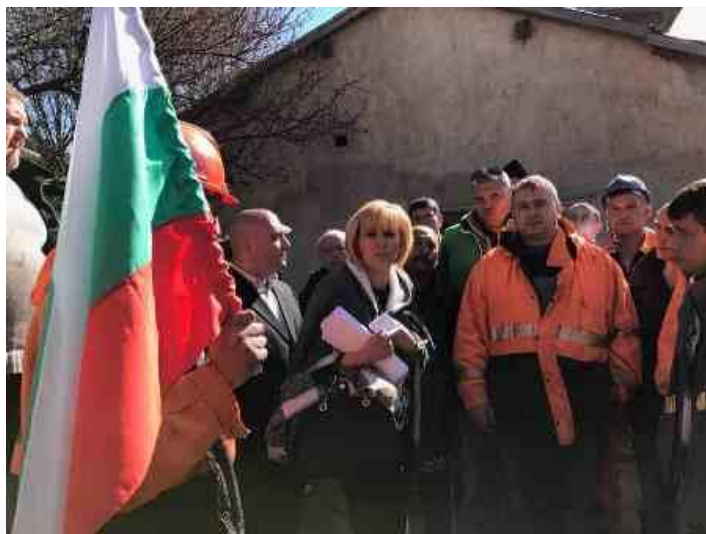
Мангановата мина в Оброчище